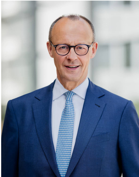
Friedrich Merz MdB Bundesvorsitzender der CDU Deutschland